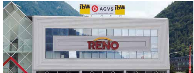
Standort Sommerastrasse Chur